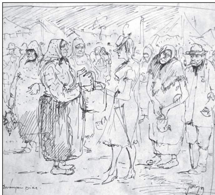
Simó Lajos: Ványai piac

múzeumokba — kerülnek. Ez garantálhatja leginkább az értékek megőrzését, megteremti a tudományos kutatás szakszerű feltételeit, s részben lehetővé teszi az értékek nagyközönség számára történő bemutatását. Nos, főként ez utóbbival, a köz számára történő bemutatással kapcsolatban van hiányérzetem. És most hagyjuk is a történeti kataklizmák, háborúk, forradalmak, rendszerváltozások okozta pusztulásokat, a kis- és nagyhatalmak történelmi tudatmódosító és múlteltörlési kényszerzeit, Dévaványa közigazgatási sodortatásainak veszteségeit! Arról van szó, ami megmaradt.