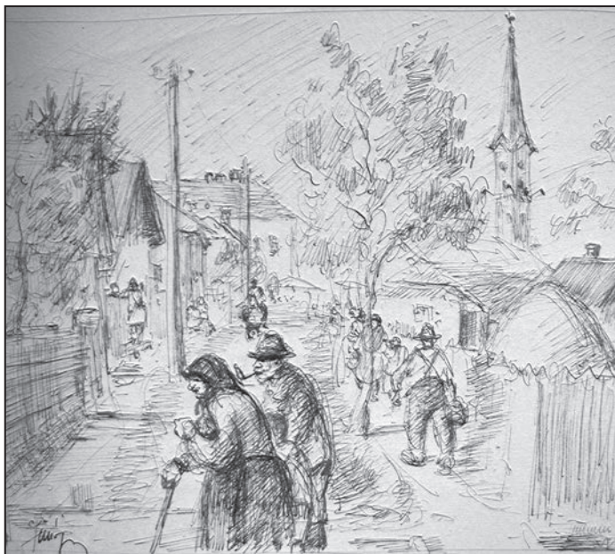
Simó Lajos: Köleshalmi utca