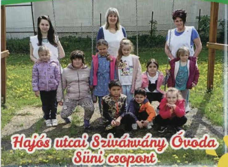
Hajós utcai Szivánvány Óvoda Süni csoport

DÉVAVÁNYA VÁROS ÖNKORMÁNYZATA TÁJÉKOZTATÓ LAPJA