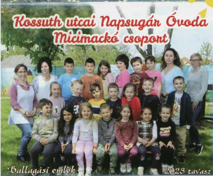
Kossuth utcai Napsugár Óvoda Micimackó csoport