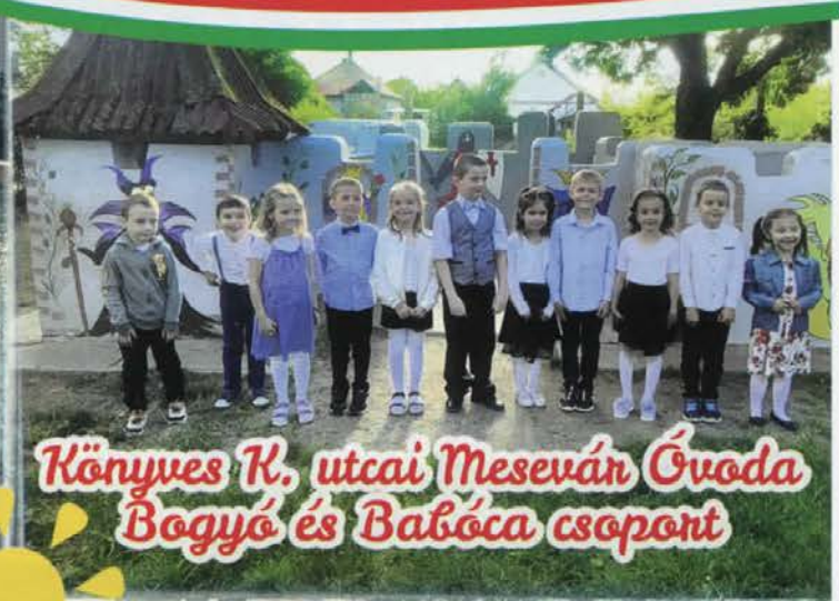
Könyves K. utcai Meseván Óvoda Bogyó és Babóca csoport