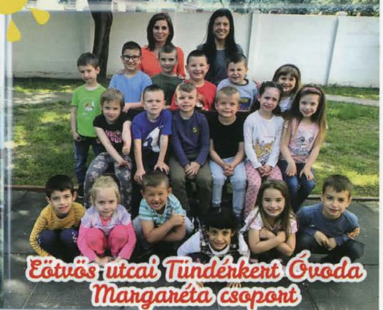
Eötvös utcai Tündérenk Óvoda Mangaréta csoport