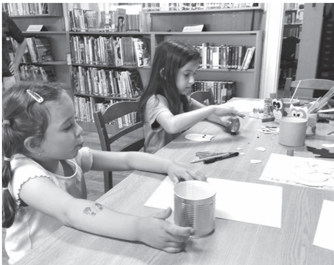
Gyermeknapi kézműves foglalkozás a könyvtárban

A könyvtár újra várja a látogatókat. Arra kérünk mindenkit, hogy a lejárt határidejű kölcsönzött könyveket szíveskedjen visszahozni. Állományunk sok új könyvvel gyarapodott, bizonyára mindenki talál kedvére valót! Várunk mindenkit szeretettel!