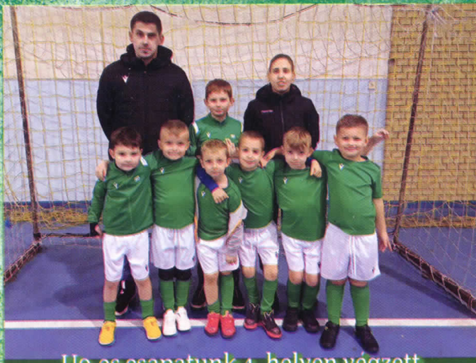
U9-es csapatunk 4. helyen végzett a XIII. Miklós kupán