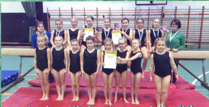
Tornászok a Diákolimpia megyei döntőjében