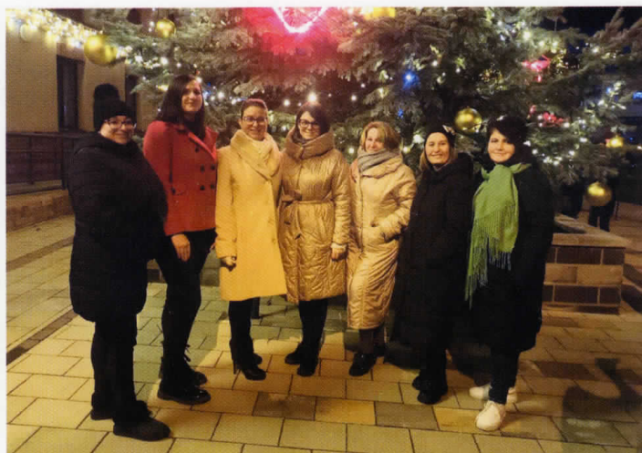
A ProVocal Kamarakórus is fellépett az I. adventi gyertyagyújtáson

Kérjük a Tisztelt Lakosságot, hogy támogassák adójuk 1 %-ával a Nagycsaládosok Dévaványai Egyesületének működését!