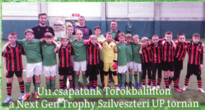
U11 csapatunk Törökbalinton a Next Gen Trophy Szilveszteri UP tornán