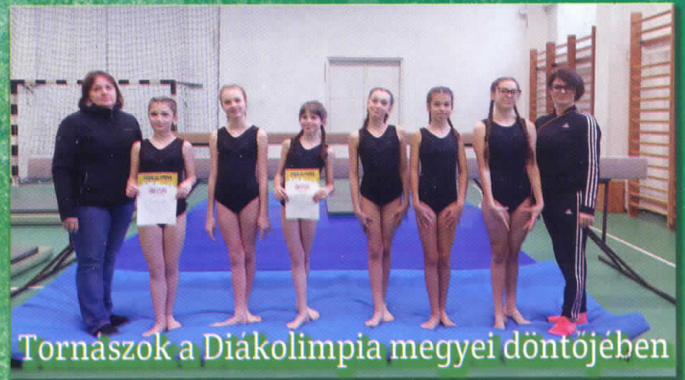
Tornászok a Diákolimpia megyei döntőjében