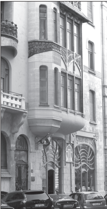
A Magyar Szecesszió Háza