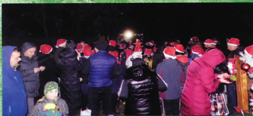
A Mikulással futottunk...