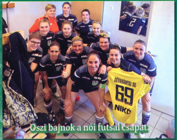
Őszi bajnok a női futsal csapat