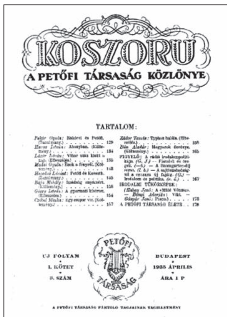
A Koszorú, a Petőfi Társaság havi közlönye

/Forrás: Mikszáth Kálmán: Jó-kai Mór Élete és kora, Szépirodalmi Könyvkiadó, Budapest, 1982.; képek: Petőfi Társaság - Petőfi Társaság - Wikipédia; letöltve: 2025.07.15./