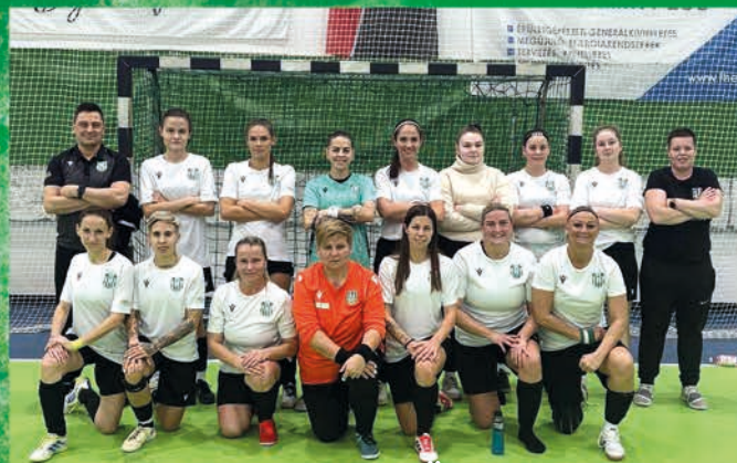
Női futsal csapatunk Üllőn lejátszotta a 2025. év utolsó fordulóját