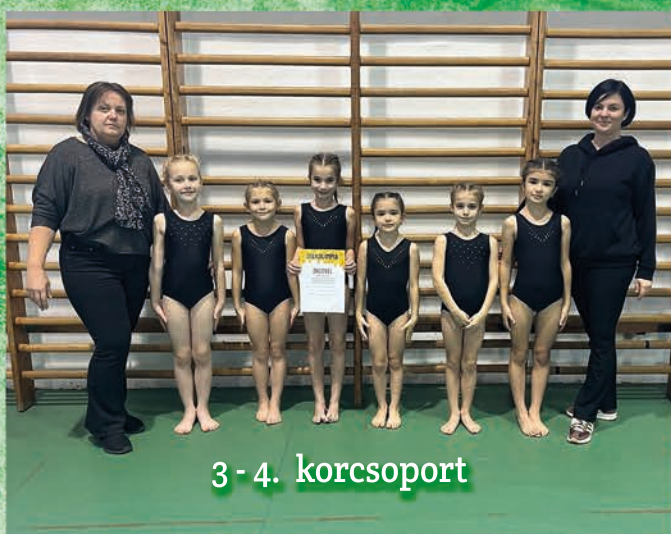
3 - 4. korcsoport