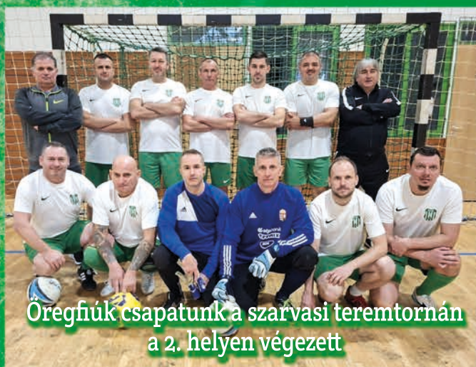
Öregfiúk csapatunk a szarvasi teremtornán a 2. helyen végzett