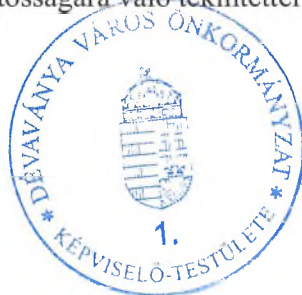
Földi Imre bizottság elnöke